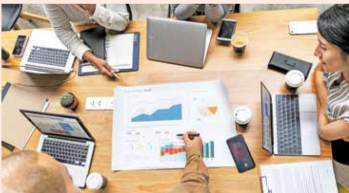
Barakaldo ofrece formación gratuita en Marketing Digital

La formación se impartirá de manera presencial en el Behargintza de Leioa de lunes a jueves de 10.00 a 14.00 horas, desde el 27 de febrero hasta el 7 de junio.